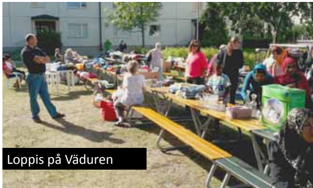
Loppis på Väduren

Den 24 augusti anordnades en loppmarknad på samma plats som grillfesten kvällen före. Vädret var vackert och utställarna många. Tyvärr kan köpintresset beskrivas som ringa. En trevlig stämning rådde dock mellan utställarna. Kaffe och läsk fanns att köpa under dagen.