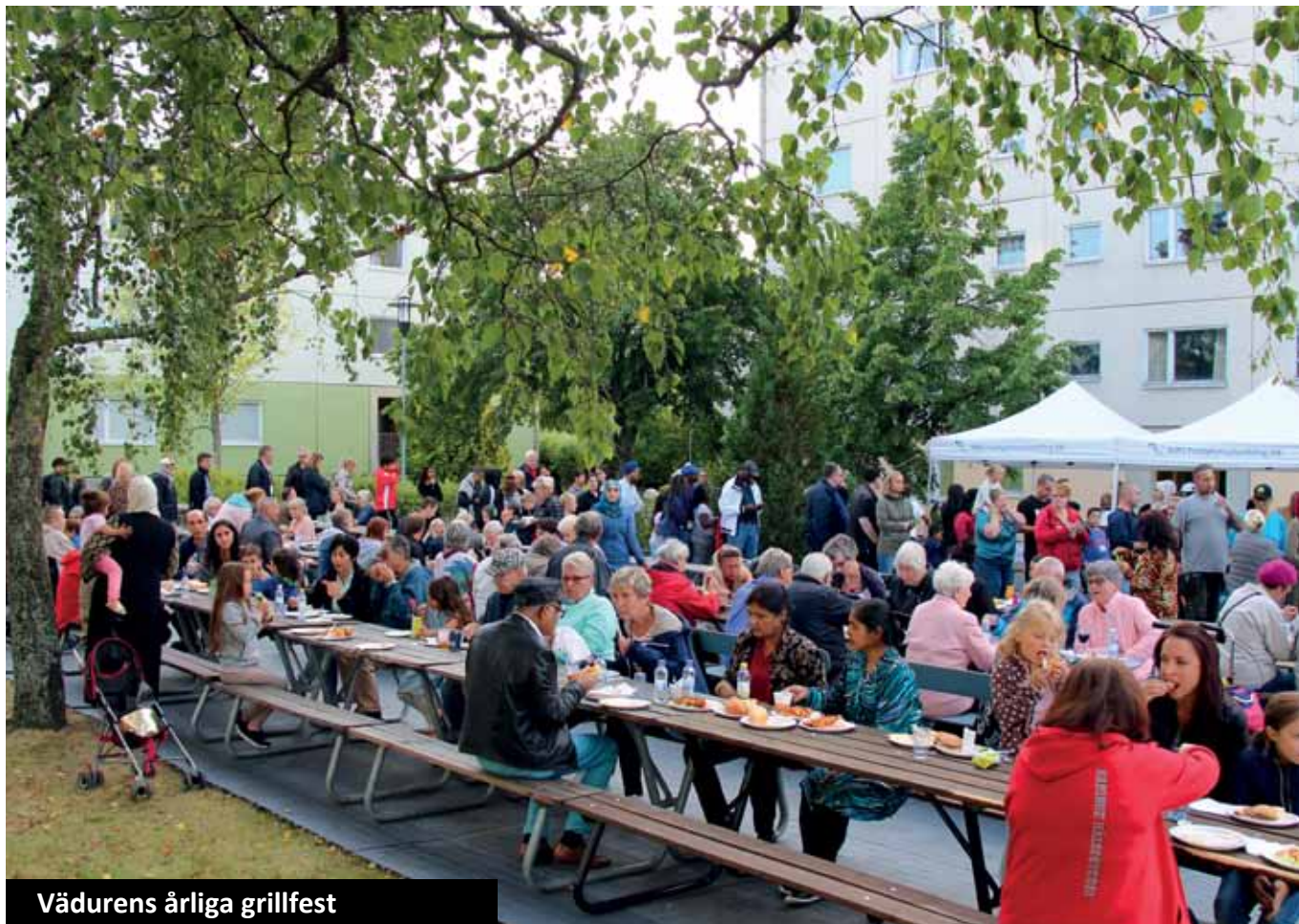
Vädurens årliga grillfest