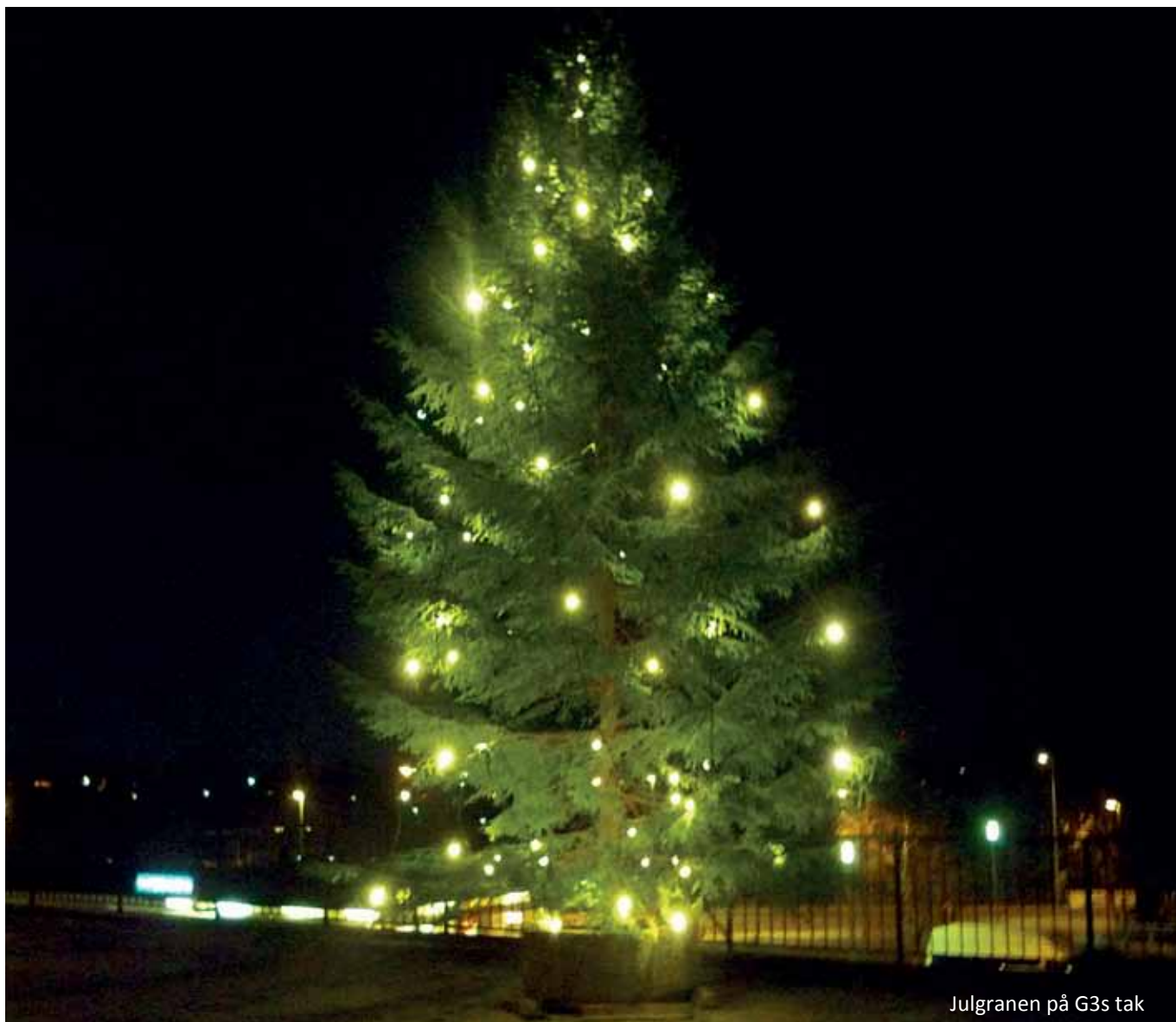
Julgranen på G3s tak