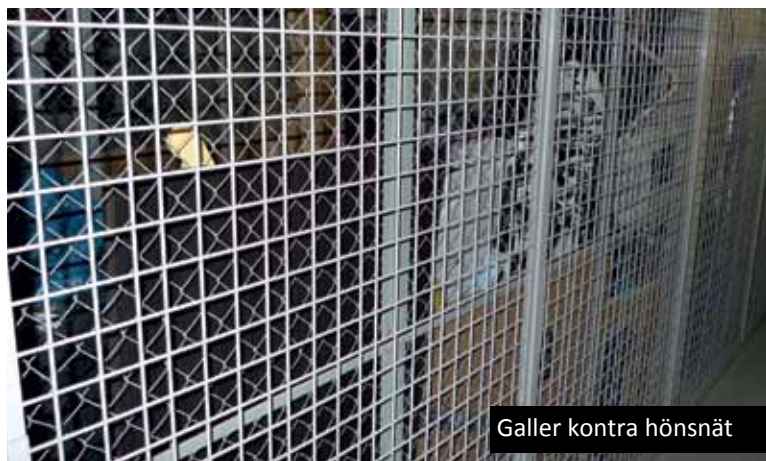
Galler kontra hönsnät