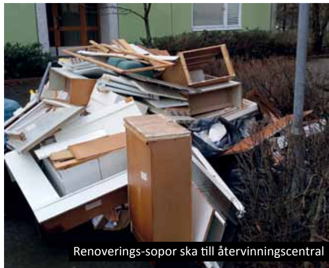
Renoverings-sopor ska till återvinningscentral