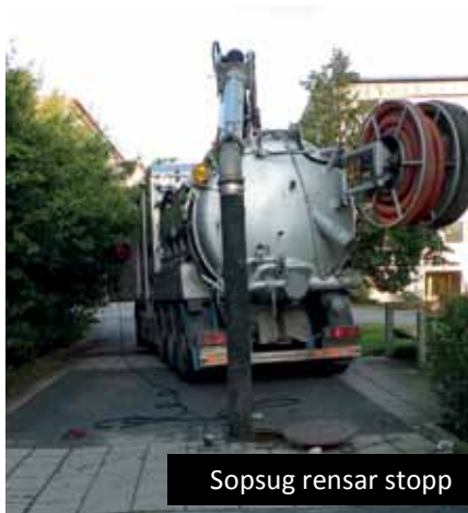
Sopsug rensar stopp

Under hösten har man behövt rensa föreningens sophantering flera gånger p.g.a. att olämpliga föremål slängts i sopnedkast. Sopnedkast är till för väl paketerade hushållssopor och inget annat.