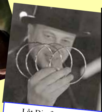
Låt Dig förtrollas! Bara bluff med "HÅKAN"