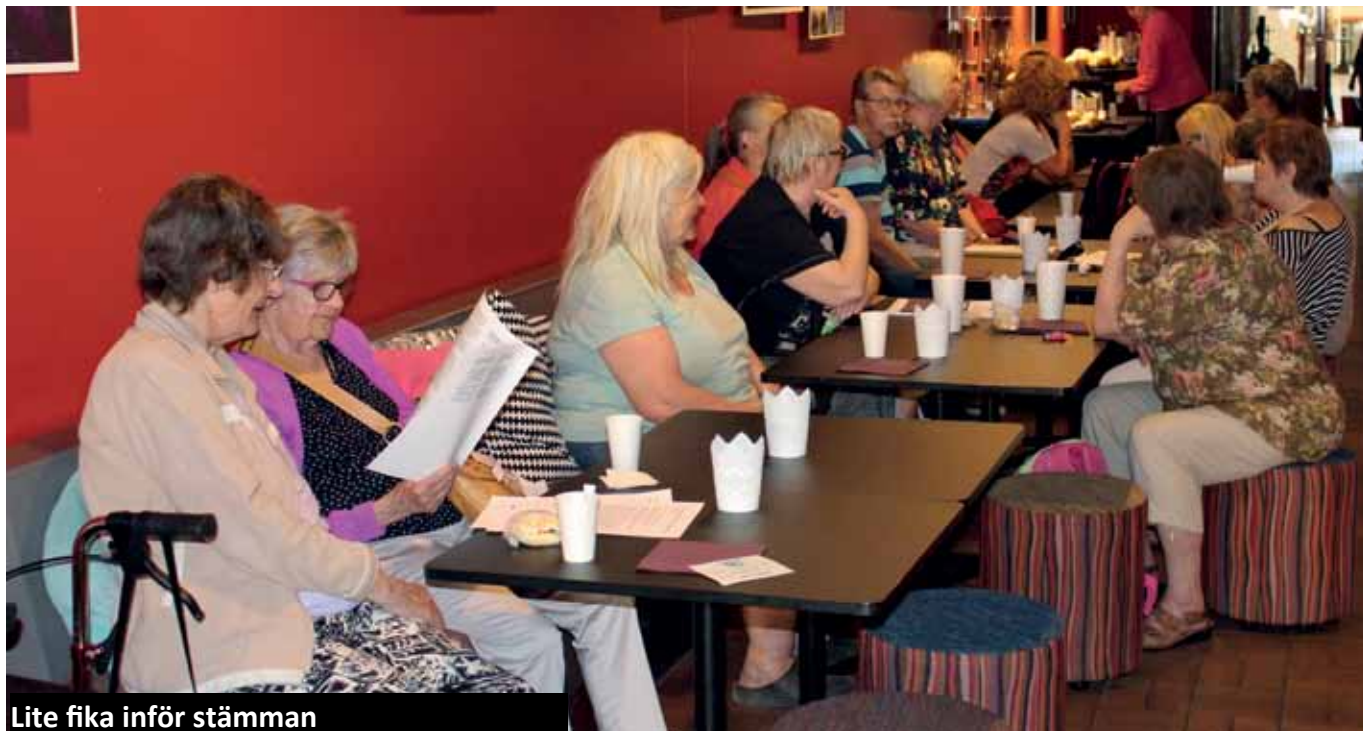
Lite fika inför stämman