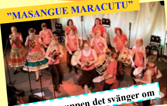
Slagverksgruppen det svänger om