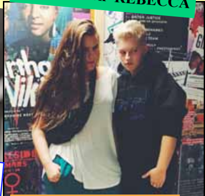
Rappare från "Vägen ut"