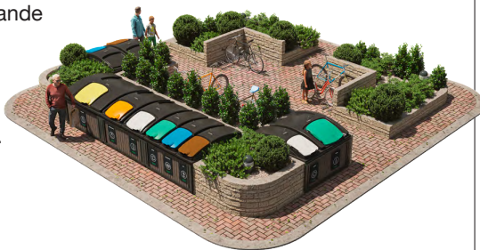
Exempel på hur det kan komma att se ut.

Det är stora men samtidigt yteffektiva behållare som grävs ned och kostar en bråkdel av vad sopsugen skulle kosta. Dessutom kan man då ha olika kärl för den sortering som det blir lag på vilket gör det enklare att slänga rätt. Bygglov för detta är inskickat.